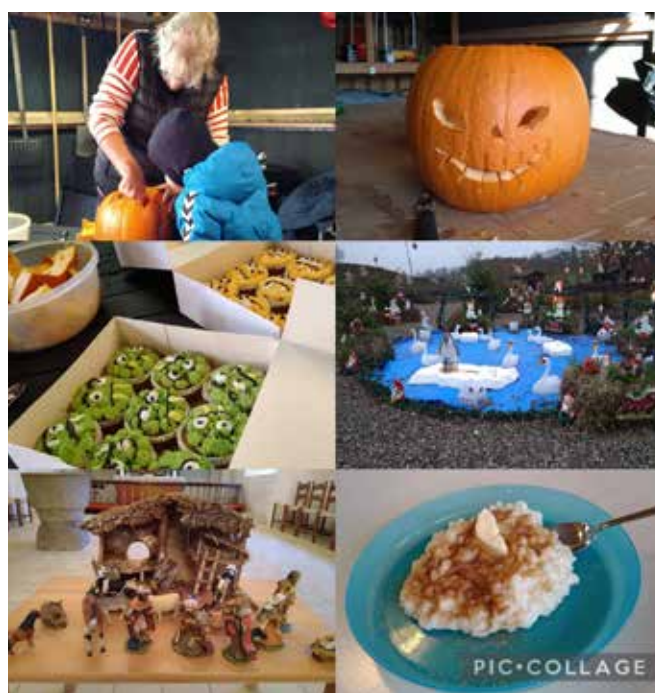
Hilsen NaturOasen Løjt Kirkeby

I december besøger vi Løjtlands Juleland på Løjt Bjergholt, er til julegudstjeneste i Løjt Kirke, hygger, spiser risengrød og ikke mindst af alt: juleafslutning i spejderhytten med juletræslytning og forældrekaffe. I det nye år er vi igen klar med en masse spændende ting og sager, som passer til årstiden.