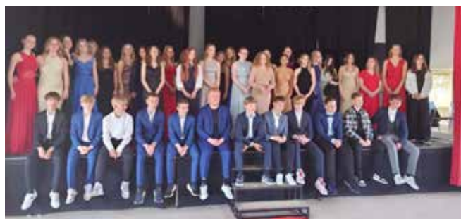
Nuværende 9. årgang til filmgalla sidste år

Uanset hvornår vi tager afsted, er det et vigtigt valg, og mange er i tvivl om, hvad de skal vælge.