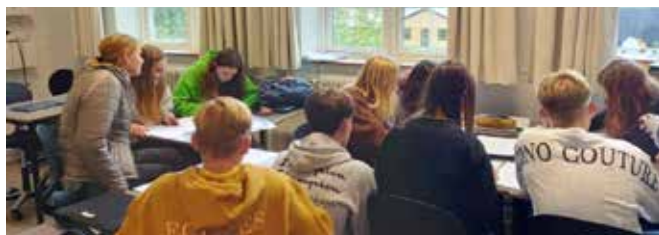
9. årgang forbereder motionsløbet.

Men det er ikke kun sjov med aktiviteter, der er også meget praktisk planlægning, som vi skal have styr på.