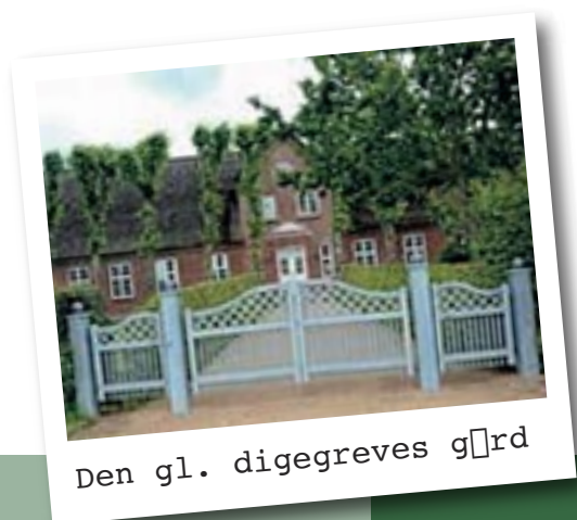
Den gl. dige greves gård

Pensionistforeningen deltager i arrangementet Løjterlig Lørdag, som er en tilbagevendende begivenhed i Løjt. Hvad pensionistforeningen bidrager med, er endnu ikke besluttet, men planlægningen er i fuld gang. Vi er selvfølgelig med i programmet, så vær opmærksom på, hvad der sker den dag, og deltag gerne i alle arrangementerne.