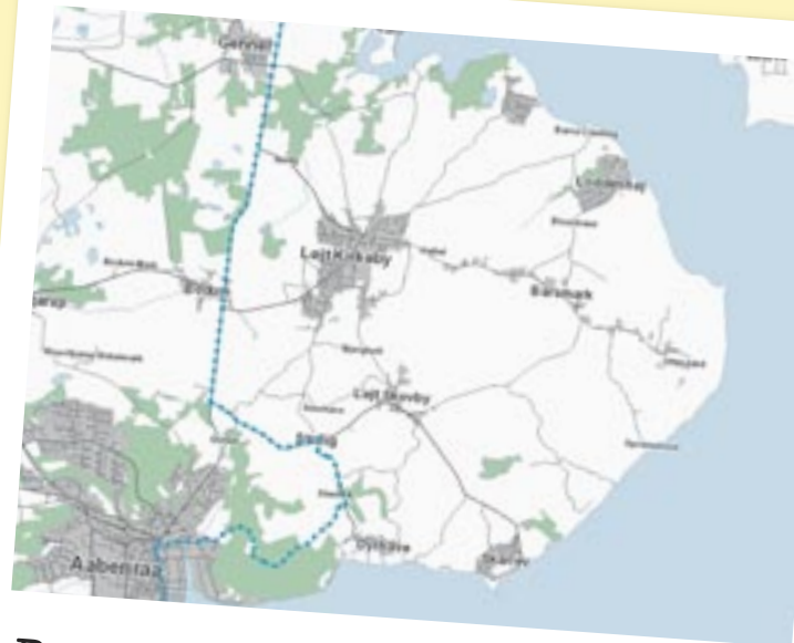
Ruten på løjt land

Fællesrådet arbejder på at lave en happening ved rundkørslen i Bodum, og fællesrådet håber at se mange tilskuere både i Bodum og på resten af ruten. Da bl.a. Bodumvej er spærret på dagen, opfordrer fællesrådet til, at man går eller tager cyklen til Tour de France-ruten.