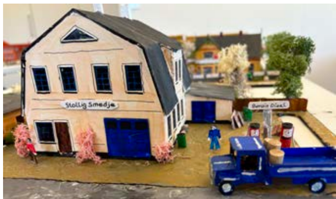
Stollig Smedje på Stolligvej. I baggrunden skimtes en model af Jens Closters eget barndomshjem på Kongensgade i Stollig.